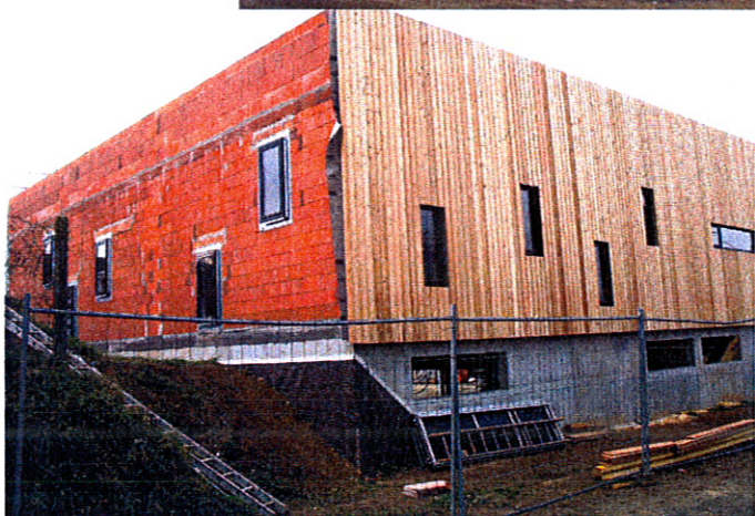
Vue de la rue des Alleux.