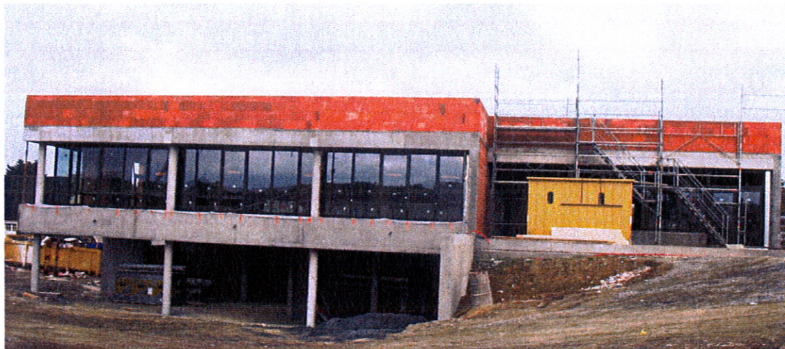
Vue du collège.