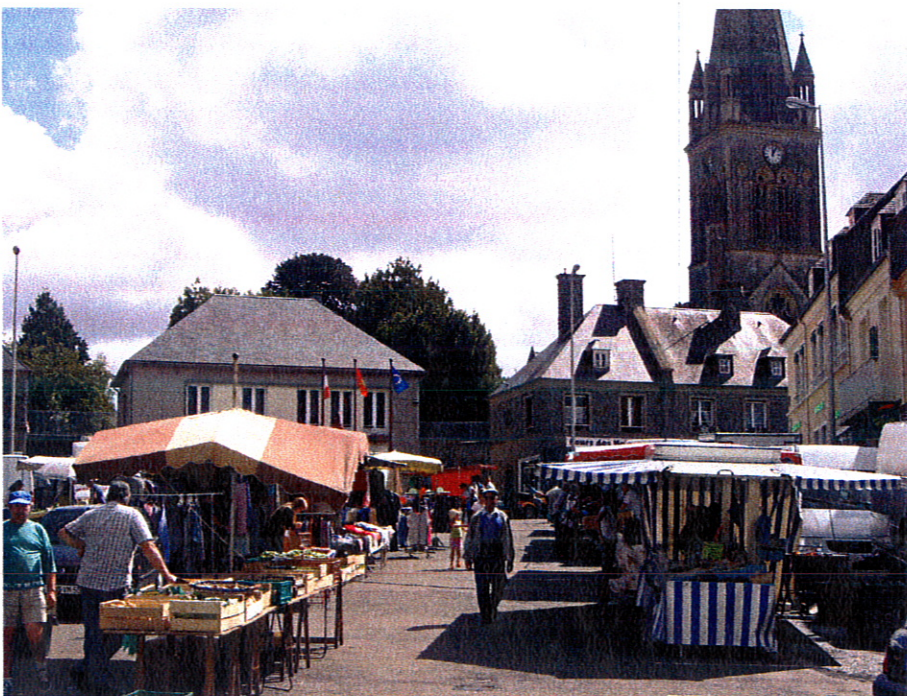
Un Mercredi à Marigny : le marché...

Le conseil municipal donne son accord et décide d'ouvrir un crédit de 7500 € .