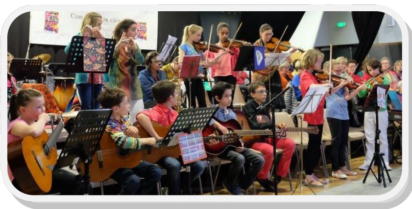
Concert du 4 juin 2016.

Une chorale composée de 70 personnes de 25 à 75 ans fait partie intégrante de l'école. De par son rayonnement, elle recrute toujours et la qualité de ses prestations est appréciée. La chorale a assuré également de nombreuses prestations et l'année scolaire va s'achever par les concerts de fin d'année les 4 juin à Hébécrevon et le 5 juin à Canisy, un concert le 18 juin dans la chapelle du Château Bérigny et une prestation dans l'église Sainte Croix de Saint Lô à l'occasion de la fête de la musique. La chorale adulte se réunit le lundi de 20 heures à 21 heures 30.