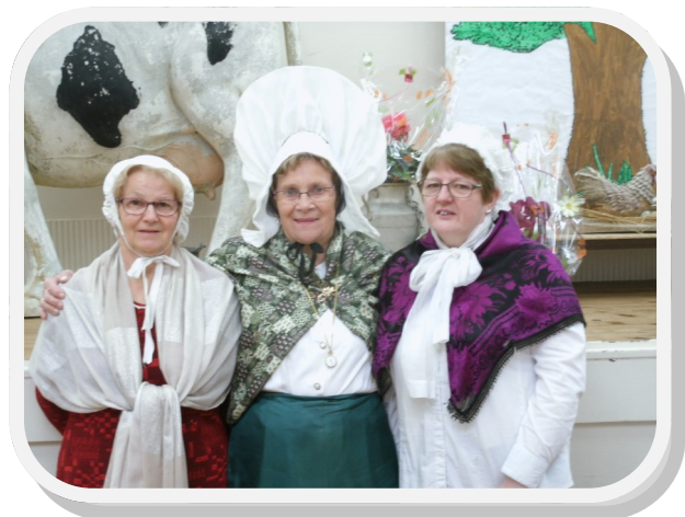
Bénévoles au repas de 2015.

Contact : Valérie BISSON Tél : 02.33.55.19.15