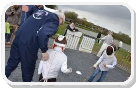
Journée sport en famille...

L'association va connaître quelques départs de membres actifs cette année. C'est pour cela que nous invitons tous parents d'élèves volontaires à venir nous rejoindre afin de mener à bien les futures manifestations.