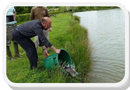
Lâcher de truites à l'étang.