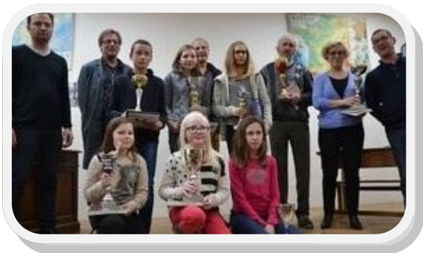
Gagnants de la grande dictée...

En effet, ce n'est pas moins de 10 manifestations qui ont eût lieu cette année, matinées croissants, marché de Noël, vente de sapins, galette des rois, la grande dictée, carnaval, journée de la randonnée, apéro concert, soirée grillade.