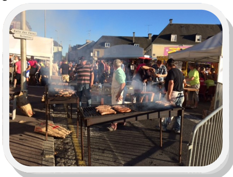
Repas familial fête Saint Pierre

Si votre emploi du temps vous le permet quelques jours par an, n'hésitez pas à nous rejoindre. Toutes les bonnes volontés et les idées nouvelles sont les bienvenues !!!