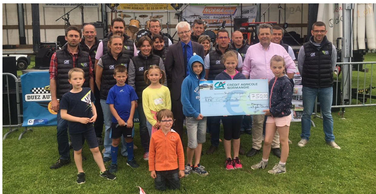
L'équipe de l'ape avec ses nouvelles doudounes financées par le Crédit Agricole.