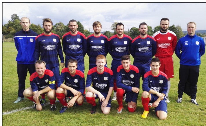
l'équipe 1A de football.