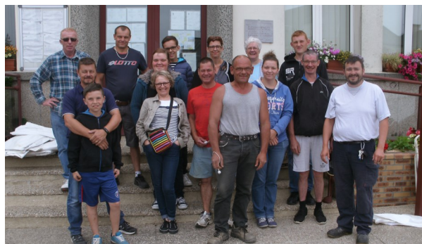
Membres et bénévoles de la fête Saint-Pierre 2017