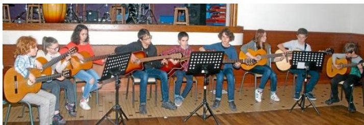
Les jeunes musiciens en audition.

Depuis l'an dernier de nouvelles activités sont proposées : l'atelier chant, le groupe de saxophones et l'orchestre des jeunes.