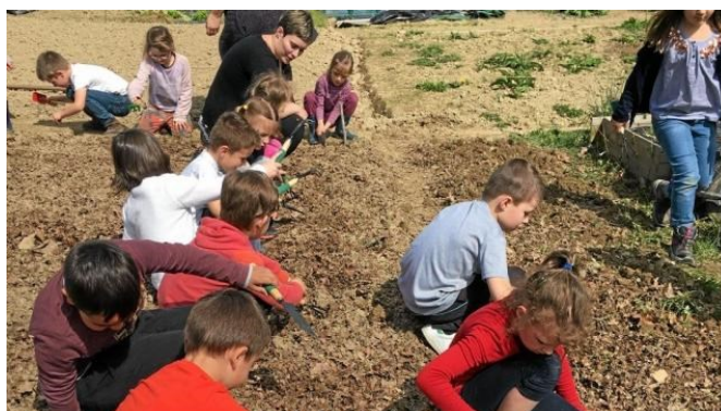
Les élèves de l'école Julien Bodin en pleines semences.