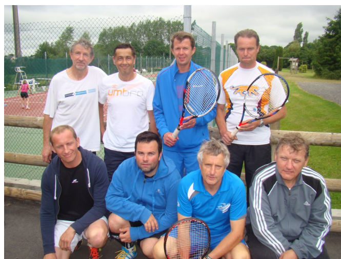
Equipe des séniors