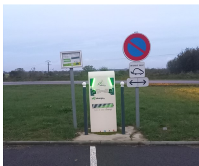
À l'aire de covoiturage

2 bornes de recharge de véhicules électriques sont à disposition des usagers à Marigny-le-Lozon.