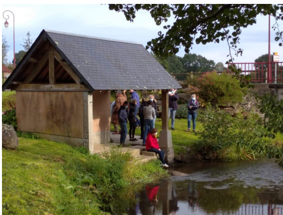
Lavoir de Lozon.

Après en avoir délibéré, à l'unanimité, le conseil municipal : Accepte le transfert des parcelles AB 636 et AB 637 (commune déléguée de Marigny) au profit de la commune de Marigny-le-Lozon, dit que cette acquisition est gratuite et autorise Monsieur le Maire à signer toutes les pièces nécessaires à ce transfert de propriété.