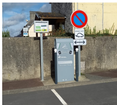
devant le collège rue du 8 mai 1945.