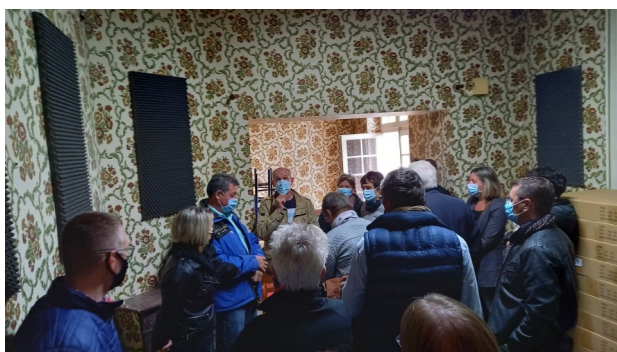
Logement derrière la poste.