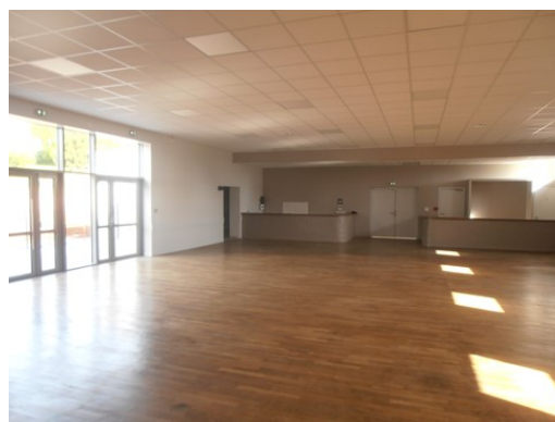
Salle des fêtes de Lozon

Après en avoir délibéré, à l'unanimité, le conseil municipal accepte le remboursement des arrhes ci-dessus.