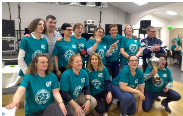
Equipe de la saison 2000-2001 qui avait gagné la coupe de la Manche et la montée en régionale, lors du 60 ème anniversaire du club