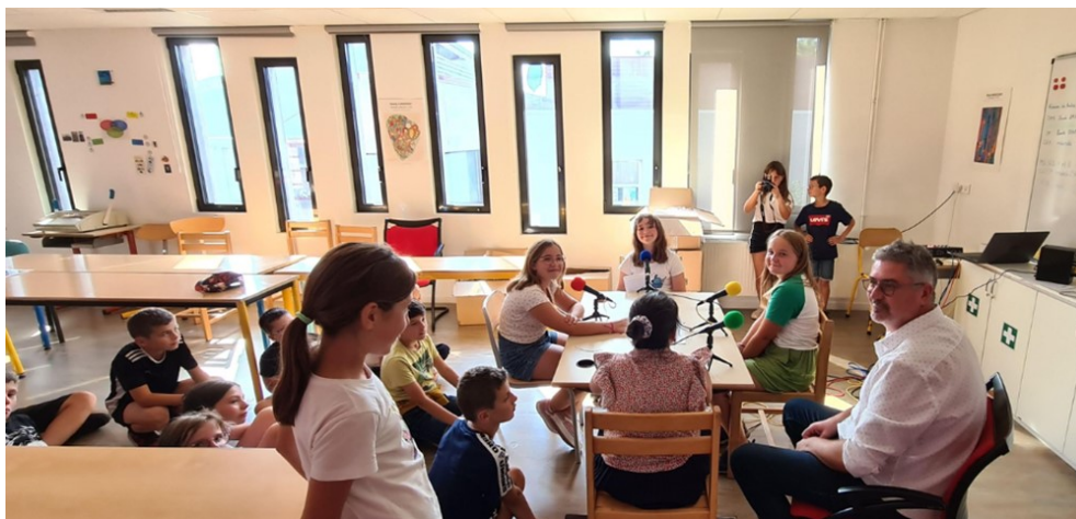
Les candidats aux élections d'éco-délégués utilisent la Web radio pour présenter leurs programmes.

Lundi 4 septembre, les 300 élèves de l'école Julien Bodin ont repris le chemin de l'école. Répartis en 13 classes, un dispositif ULIS et une classe externalisée de l'IDRIS, c'est parés de leurs plus beaux sourires qu'ils ont retrouvé avec joie leurs camarades, enseignants et personnels municipaux. Deux grandes nouveautés au programme de cette année : expérimentation de « l'école du dehors » en lien avec le label E3D niveau 2 obtenu l'année passée et en collaboration avec « les amis de l'îlot de biodiversité » et mise en place d'une webradio qui permettra aux élèves de travailler l'oral, la lecture et également de valoriser leur travail. Parmi les autres projets, il y aura le voyage à Paris des CM2 en fin d'année scolaire, l'envoi de colis aux enfants de Lyman... L'objectif de l'équipe : former des citoyens éclairés qui sauront prendre à bras-le-corps les grands défis de demain.