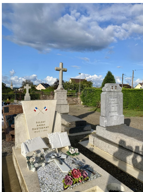
Sépultures de combattants